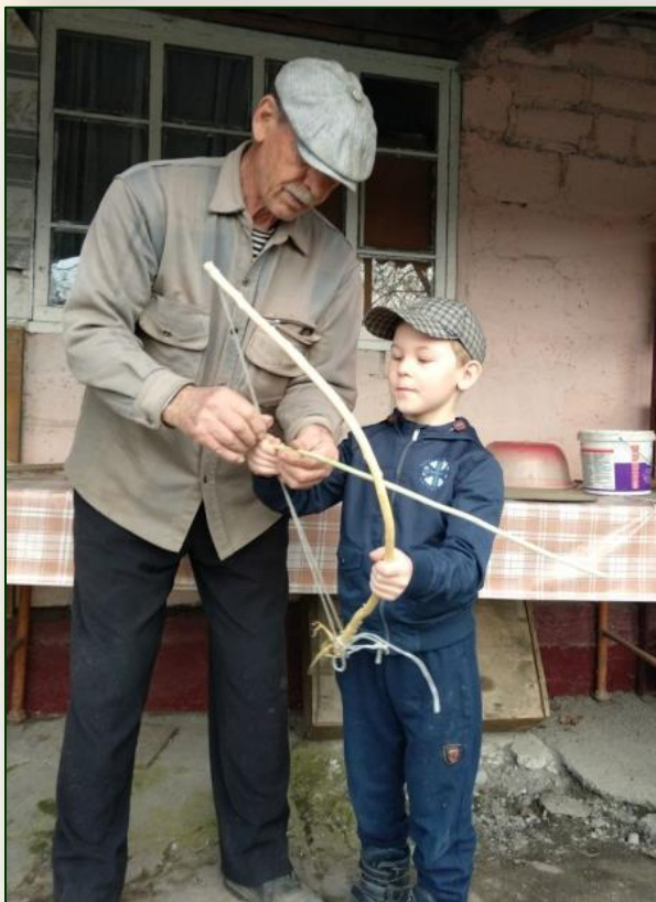
Мастер-класс «Учимся изготавливать лук»