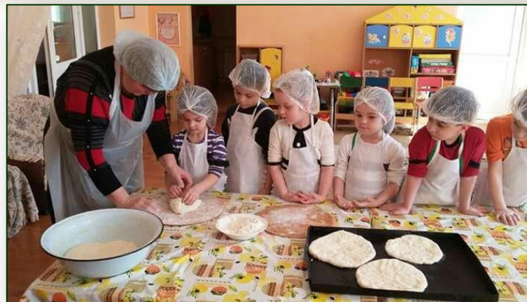
Мастер-класс «Печем осетинские пироги»