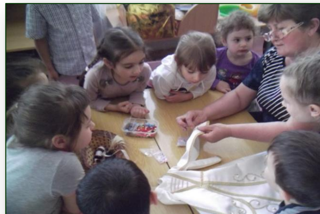
Мастер-класс «Делаем бусы»