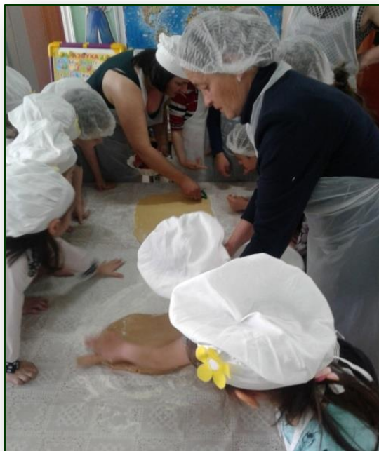
Мастер-класс «Печем печенье»