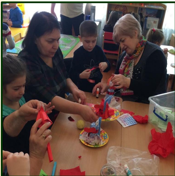
Мастер-класс «Чем занять ребенка дома»