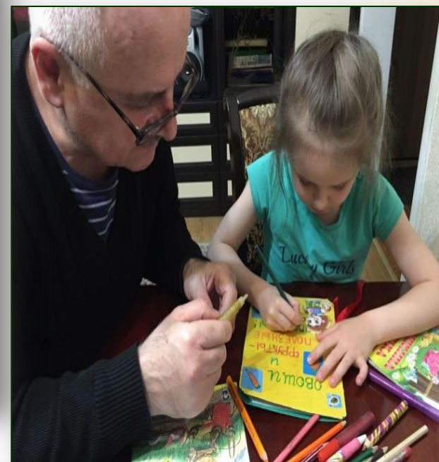
Мастер-класс «Изготавливаем книжку-малышку»